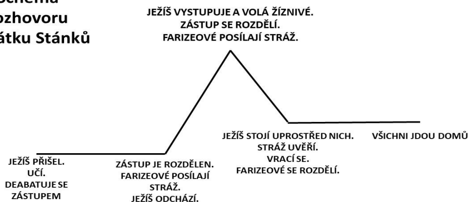
Schéma rozhovoru o svátku Stánků